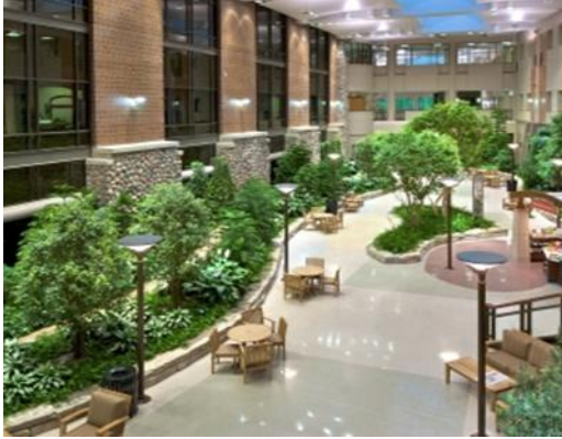
صورة (3) توضح استخدام النباتات ذو اللون الأخضر لاضفاء روح الهدوء النفسي